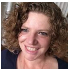
פרופ' שיזף רפאלי